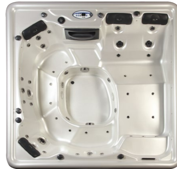
ACRYLIC BY Lucite .SPA USA