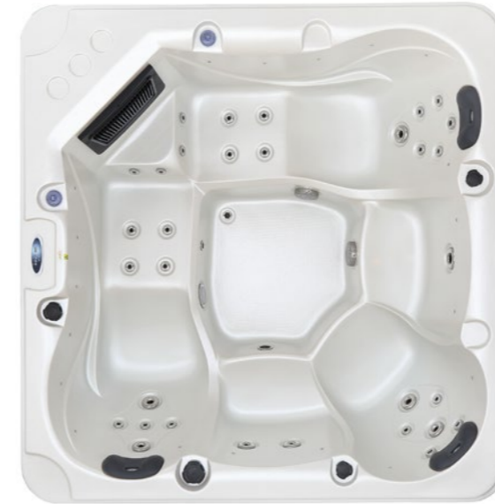
ACRYLIC BY Lucite .SPA USA