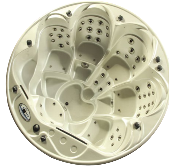
ACRYLIC BY Lucite .SPA USA