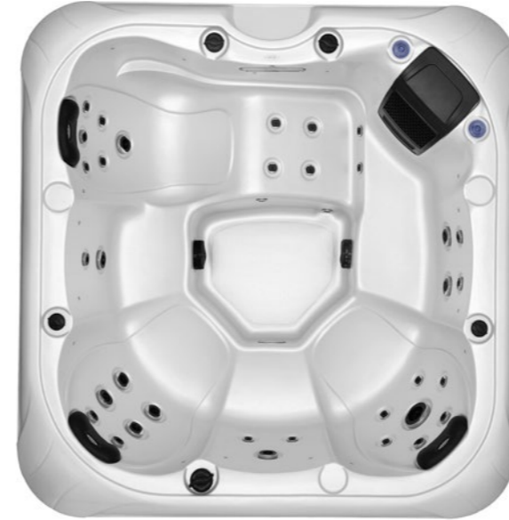
ACRYLIC BY Lucite.SPA USA