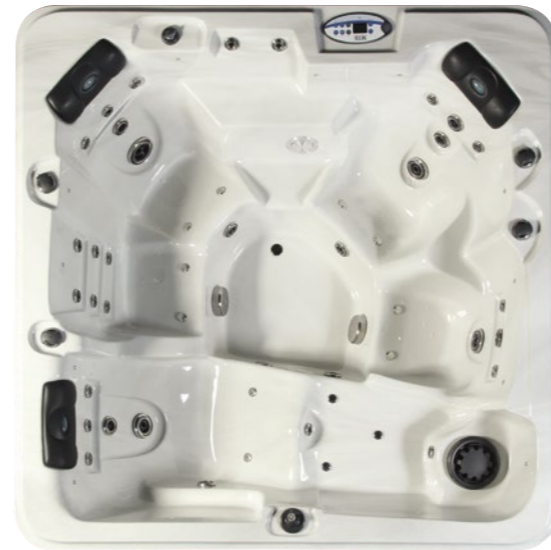
ACRYLIC BY Lucite .SPA USA